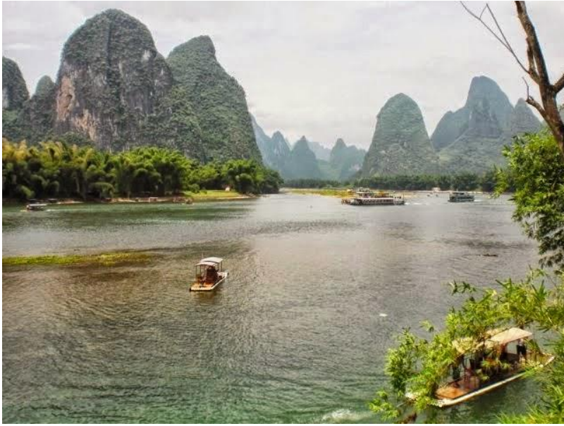
Foto del paisaje original