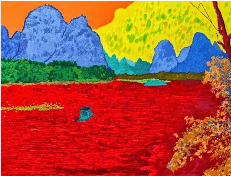
Mismo paisaje visto por un fovista