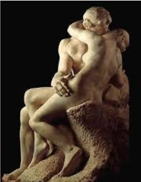
El beso. A. Rodin.

-Imagen realista: Representan objetos o escenas cotidianas muy parecidas a la realidad. Intentan imitarla.