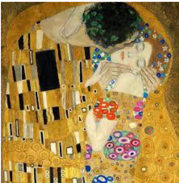
El beso. G. Klimt.

-Imagen figurativa: Representan objetos o escenas reconocibles de la realidad y pueden tener un mayor o menor grado de parecido con ella simplificándose poco a poco o distorsionándola.