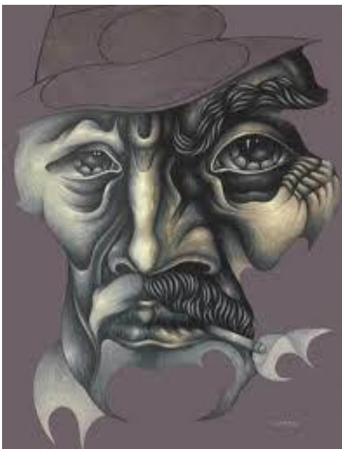
Figura compleja-fondo simple: La figura es más definida por tener mayor cantidad de detalles, más volumen o muchos y variados planos de color, valor o textura. El fondo, en cambio es resuelto en general con colores generalmente planos; si hay color, se usan colores neutros, con poco o ningún grafismo y escaso contraste entre colores claros y oscuros.

Aquellos elementos de importancia secundaria y que parecen retroceder, se convierten en el fondo (que también posee forma y tamaño).