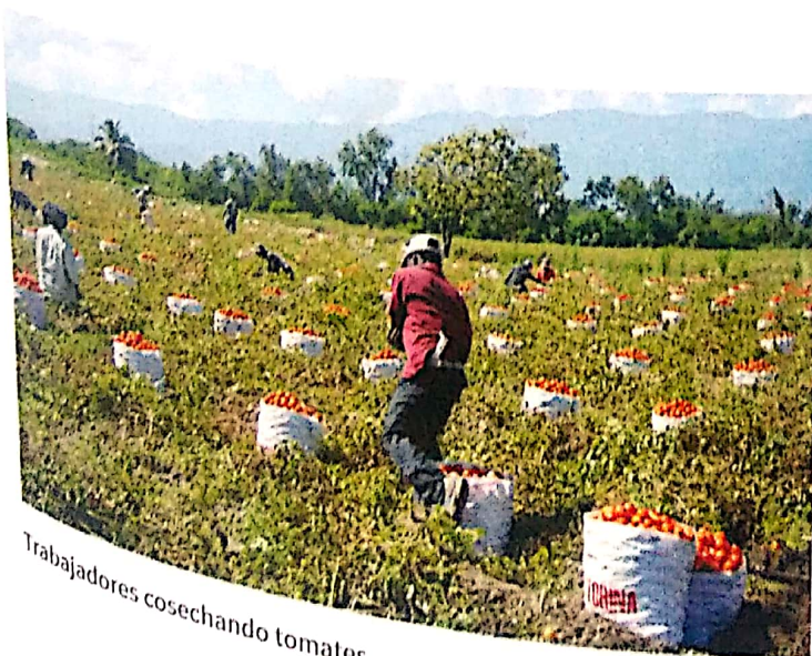
Trabajadores cosechando tomates