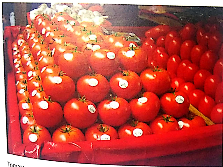
Tomates en exhibición para su venta

En una sociedad moderna la producción se lleva a cabo de manera cooperativa, es decir, se realiza a partir de los aportes de los recursos de distintas personas. A cambio de esos aportes, las personas obtienen ingresos (generalmente en forma de dinero, que es un bien especial que facilita las transacciones), que les permiten adquirir bienes y servicios. Ese proceso a través del cual cada uno entrega algo que tiene (sus recursos productivos, o sus bienes, o su dinero) y recibe algo a cambio, se denomina intercambio . En este proceso, cada factor o bien que se intercambia tiene un precio , que es el valor -medido en unidades de dinero- que se le da en dicho intercambio.